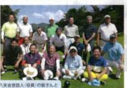
八天会世話人(役員)の皆さんと