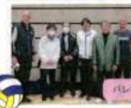
バレーボール協会 スタッフの皆さん