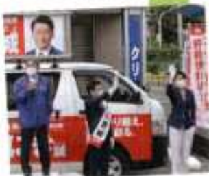
ただきありがとうございます。皆さまのご支援の御陰で嬉しい選挙ではございましたが、おにき候補の当選が叶いました。本当に感謝申し上げます。

10月20日おにき候補の応援に自民党組織運動本部長小渕優子先生と公明党参議院議員秋野公造先生が駆けつけてくださり、一斉祝賀。前とニマルキョウ井尻店一前において、力強い応援演説をいただきました。皆さまからも熱い拍手をい