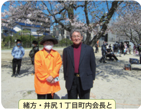
緒方・井尻1丁目町内会長と

宮竹公園開園の一周年記念行事に参加させていただきました。子ども会、シニアクラブが中心になってゲームをし、楽しい賑やかな声が響く一日となりました。