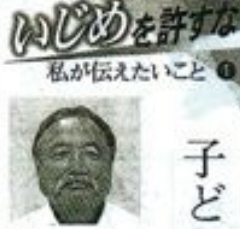
はじめを許すな 私が伝えたいこと

いじめを受けていた大津市の中学生が、自殺の原因は学校と家庭から受けたいじめだと訴えている。いじめの根絶は学校と家庭の両方から取り組まなければならない。いじめは、いじめられていた子供たちだけでなく、いじめを許した大人も責任がある。