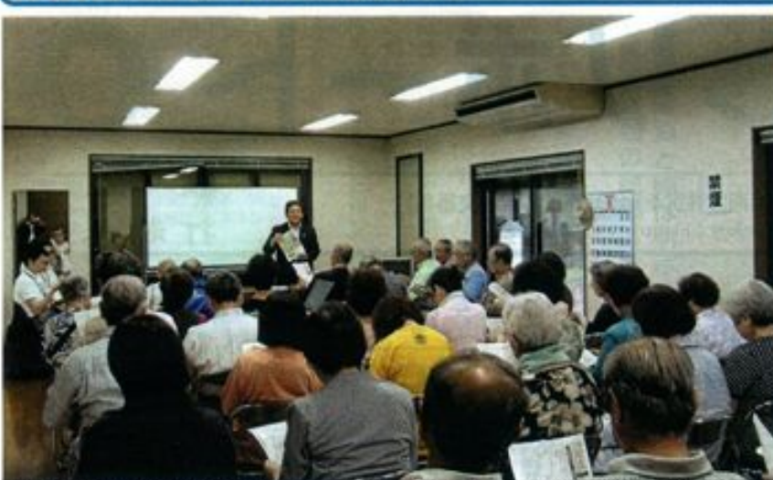
6月27日、井尻3丁目にお住まいのみなさま向けに開催した設立報告会。会場の井尻3丁目商會館には40名の方々が出席されました