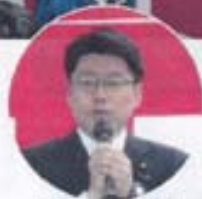
丸木誠 衆議院議員