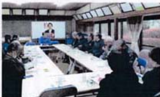
上日佐会館での様子

昨年より始めました、気軽にも何でも語り合える「かまろう会」。日頃の疑問から生活の話題、身の回りの出来事etc. 皆さまの声をお聞かせいただき、市政へと繋げて参ります。