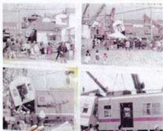
1975年(昭和50)年3月1日、井尻駅近くの踏切で発生した脱線事故の様子

平成28年6月 期成会の会長をはじめ、3000名を超える署名とともに、西鉄天神大牟田線井尻地区における連続立体交差化の早期実現を求める請願を市議会へ提出 同年12月 請願が全会派一致で採択される